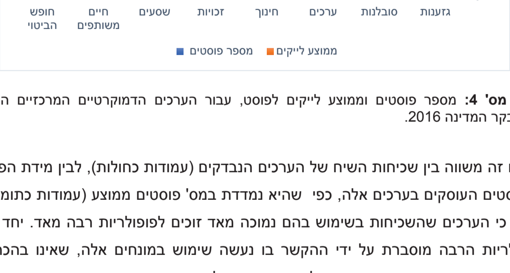
תרשים מס' 4: מספר פוסטים וממוצע לייקים לפוסט, עבור הערכים הדמוקרטיים המרכזיים המוזכרים בדוח מבקר המדינה 2016.

תרשים זה מראה את החלוקה המגדרית (באחוזים), של סה"כ השיח הפרלמנטרי עבור כל אחד מהערכים שנבדקו. ניתן לראות כי ישנם ערכים בהם השיח הנשי דומיננטי (שסעים, ערכים, גזענות, חיים משותפים). נתון זה בולט במיוחד לאור העובדה כי חברות הכנסת מהוות 30% בלבד מבית הנבחרים.