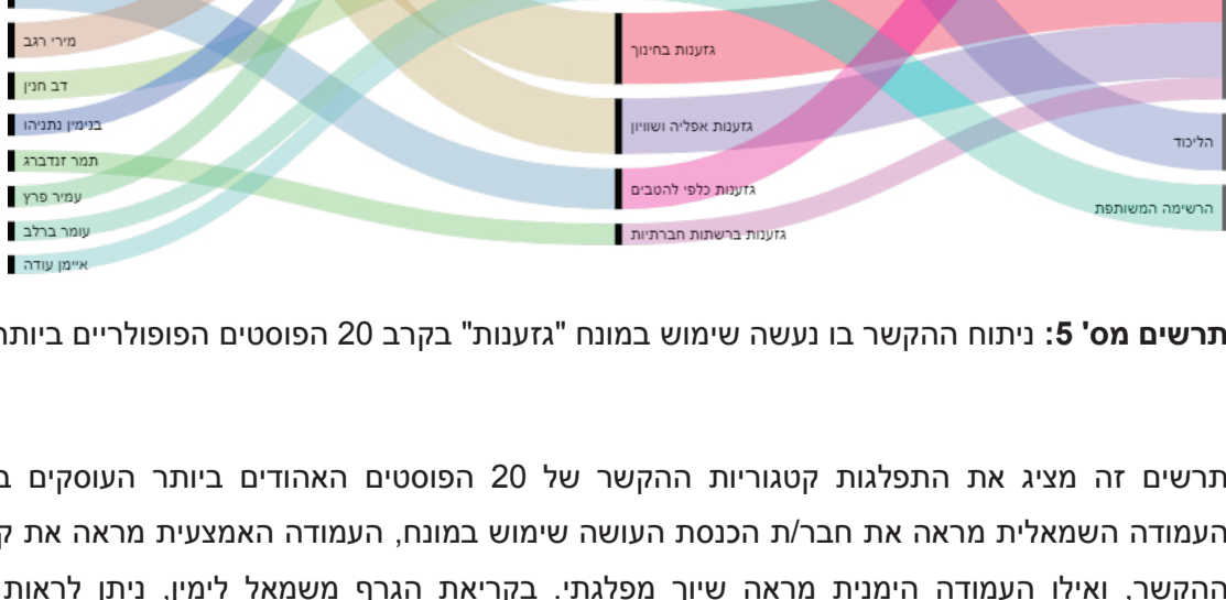
תרשים מס' 5: ניתוח ההקשר בו נעשה שימוש במונח "גזענות" בקרב 20 הפוסטים הפופולריים ביותר

תרשים זה מראה את השיח של הערכים הנבדקים (עמודות כחולות), לבין מידת הפופולריות של פוסטים העוסקים בערכים אלה, כפי שהיא נמדדת במס' פוסטים ממוצע (עמודות כתומות). ניתן לראות כי הערכים שהשיחות בשימוש בהם נמוכה מאד זוכים לפופולריות רבה מאד. יחד עם זאת הפופולריות הרבה מוסברת על ידי ההקשר בו נעשה שימוש במונחים אלה, שאינו בהכרח עוסק בחיים משותפים, מינעת גזענות או סובלנות בין יהודים לערבים.